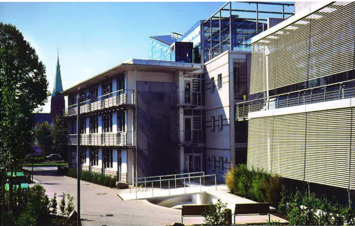
Zukunfts Zentrum Herten, Seitenansicht