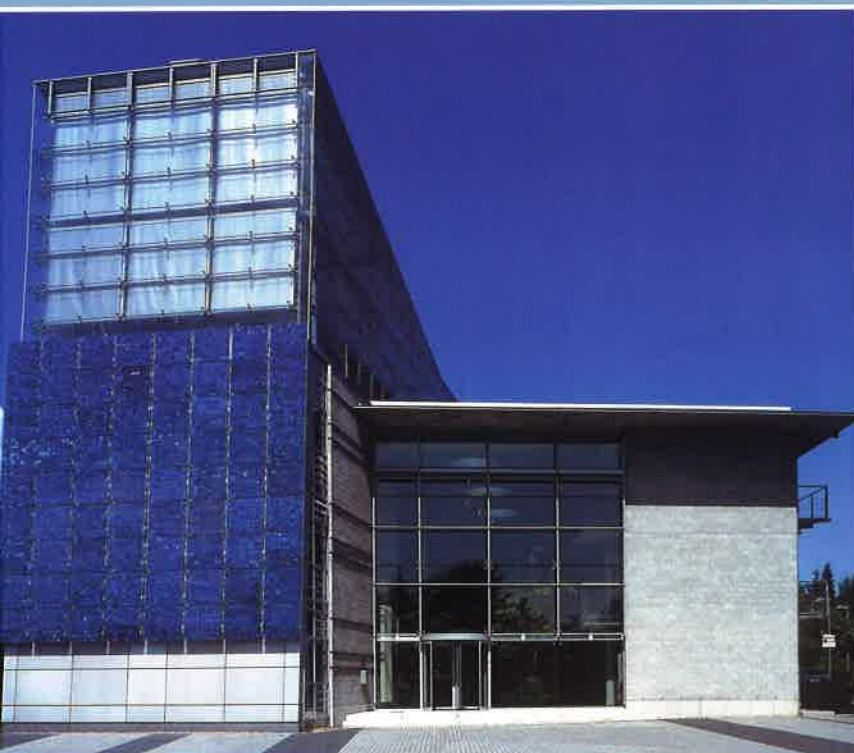
Zukunfts Zentrum Herten