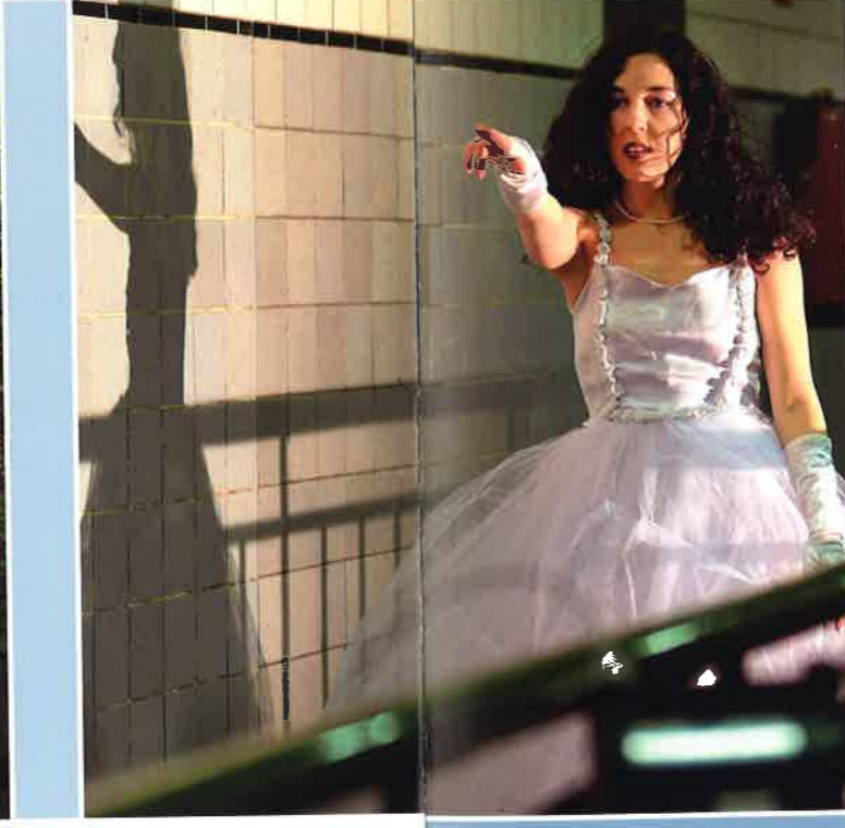
Theateraufführung „Coming Home“ im Industriedenkmal

Herten ist eine überschaubare Stadt mit 66 000 Einwohnern. Der Rückzug des Bergbaus setzt Energien frei, die Zukunft anzupacken und neu zu gestalten: Technologiezentrum, renaturierte Halden, Industriedenkmäler und das „Glashaus“ mit Bibliothek und Veranstaltungsräumen als architektonischer Akzent stehen für die Neu-Orientierung. Sowohl Sie als auch Ihre Mitarbeiter werden sich in Herten wohl fühlen.