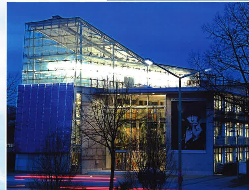
ZukunftsZentrum Herten: Herzstück des Technologieparks Herten