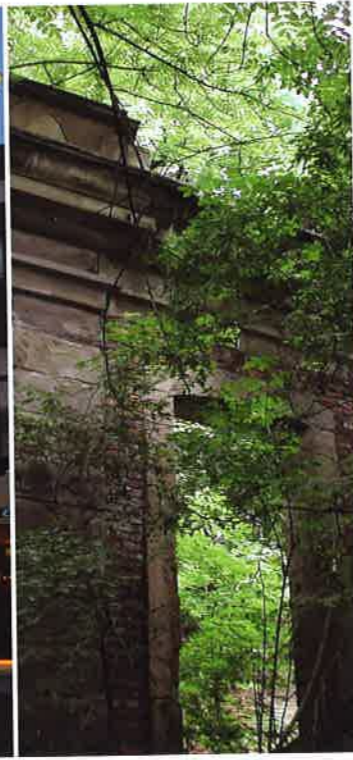
Park in Stadtnähe