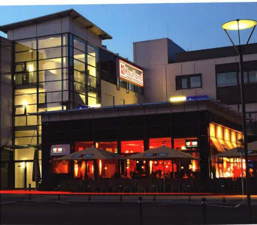
Herten, Innenstadt, nahe Rathaus