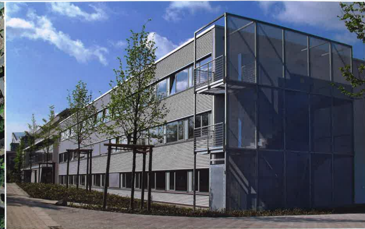
Zukunfts Zentrum Herten, Nordansicht