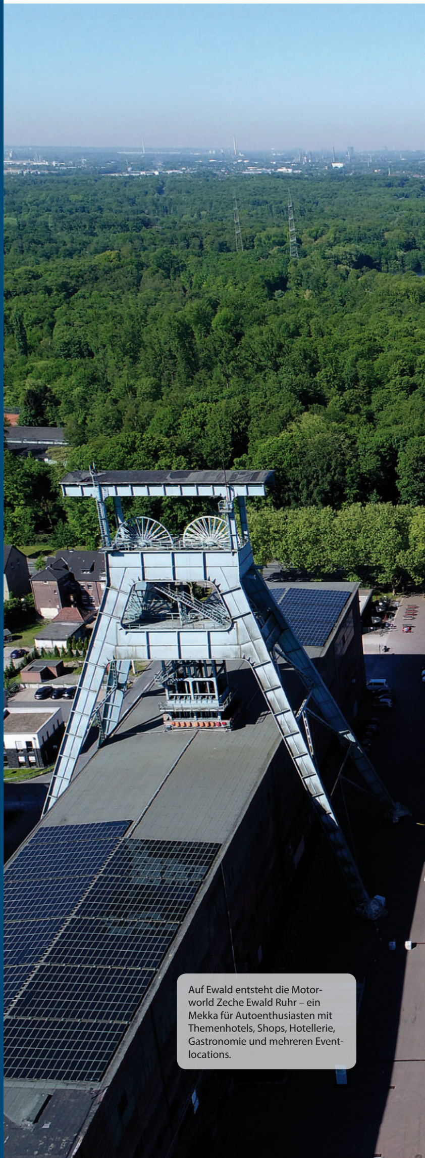
Auf Ewald entsteht die Motorworld Zeche Ewald Ruhr – ein Mekka für Autoenthusiasten mit Themenhotels, Shops, Hotellerie, Gastronomie und mehreren Eventlocations.

Foto Doppelseite: Zukunftsstandort Ewald mit Blick auf das grüne Ruhrgebiet