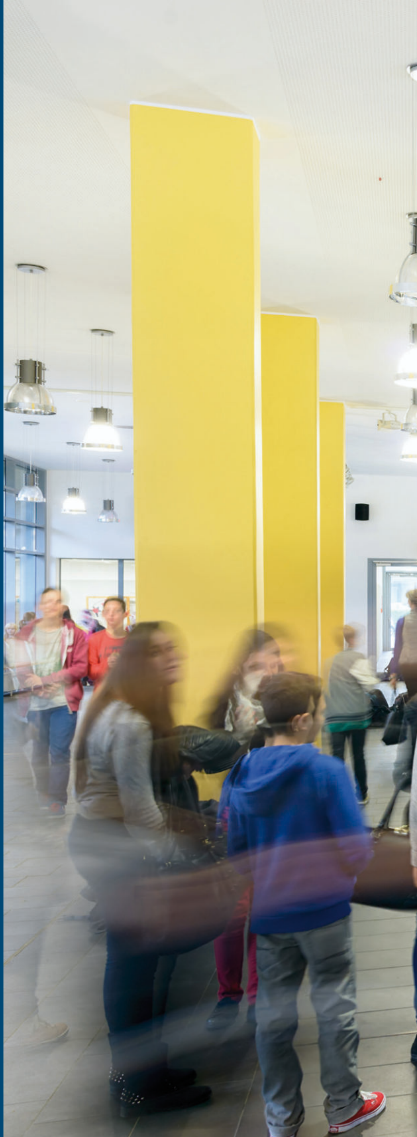
Foto Doppelseite: Foyer der Willy-Brandt-Realschule, die wie das Städtische Gymnasium auch, über einen starke MINT-Ausrichtung verfügt.

Die Westfälische Hochschule (WHS) mit ihren Standorten in den Nachbarstädten Gelsenkirchen und Recklinghausen ist ganz nah dran an der regionalen Wirtschaft – ganz gleich, ob Sie einen kompetenten Partner bei der Entwicklung neuer Produkte oder Dienstleistungen suchen oder mit Studentinnen und Studenten im Praxissemester Erfahrungen mit wissenschaftlichem Nachwuchs sammeln. Mit dem Westfälischen Institut für Gesundheit, dem Westfälischen Energieinstitut, dem Institut für Internetsicherheit und dem Forschungsverband Mechatronik setzt die Westfälische Hochschule wichtige Schwerpunkte.