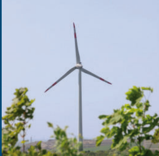
Windrad Halde Hoppenbruch