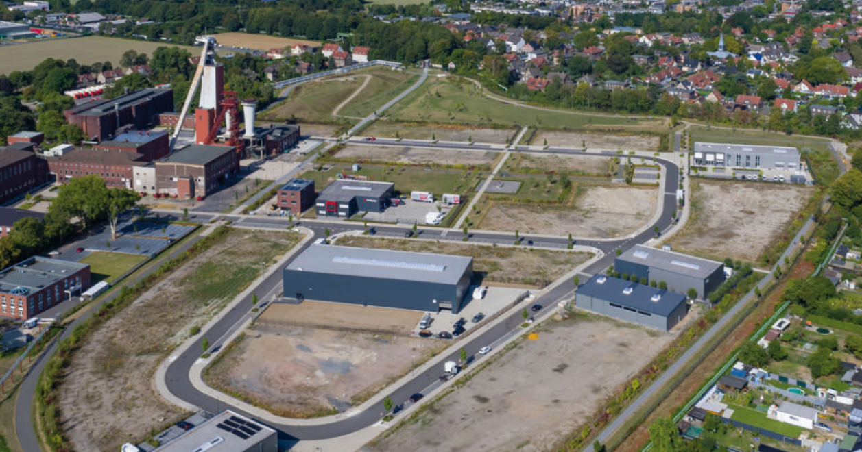
Luftaufnahme Schlägel & Eisen September 2018