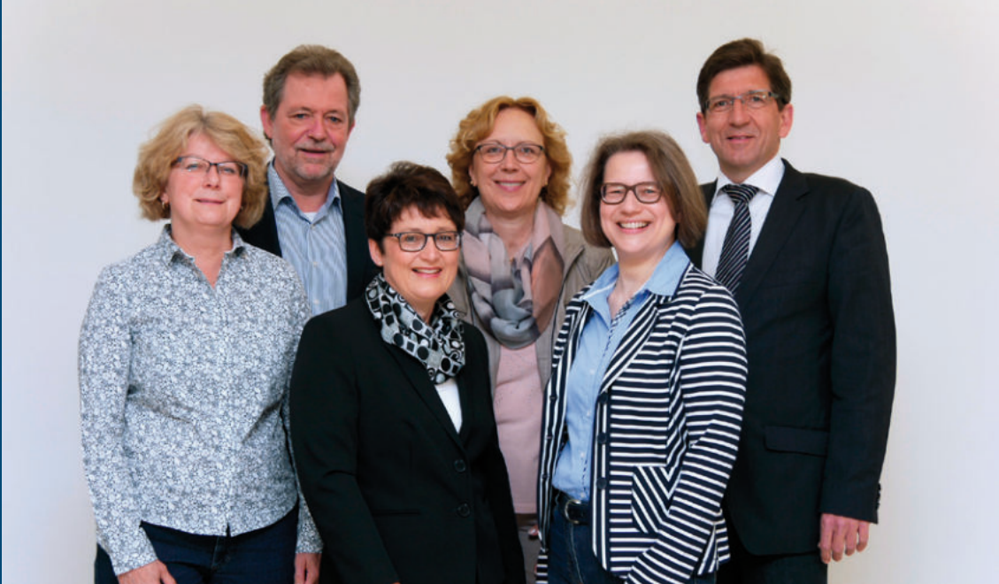
Das Team der Wirtschaftsförderung Herten