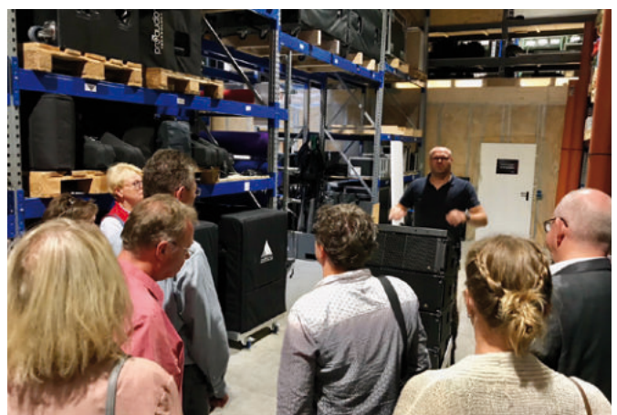
GUT-Mitglieder beim Besuch der Schallmeister GmbH in Herten

Die Wirtschaftsförderung unterstützt und bringt sich in die lokalen Unternehmensnetzwerke ein. So engagieren wir uns im Hertener Unternehmer- und Gründertreff GUT Herten e.V. und sind Mitorganisator von Netzwerktreffen, Unternehmerfrühstücken und Seminaren. Regelmäßige Besuche bei Mitgliedsunternehmen ergänzen unsere Aktivitäten. Netzwerken wird hier groß geschrieben. Die Zusammenarbeit mit dem örtlichen Einzelhandel ist für die Wirtschaftsförderung ein wichtiges Themenfeld. Unser Ziel ist die Stärkung des Einzelhandels in der Innenstadt und den Stadtteilzentren. Daher arbeiten wir eng mit den Werbegemeinschaften zusammen. Und unterstützen das Kreativ.Quartier in Herten-Süd.