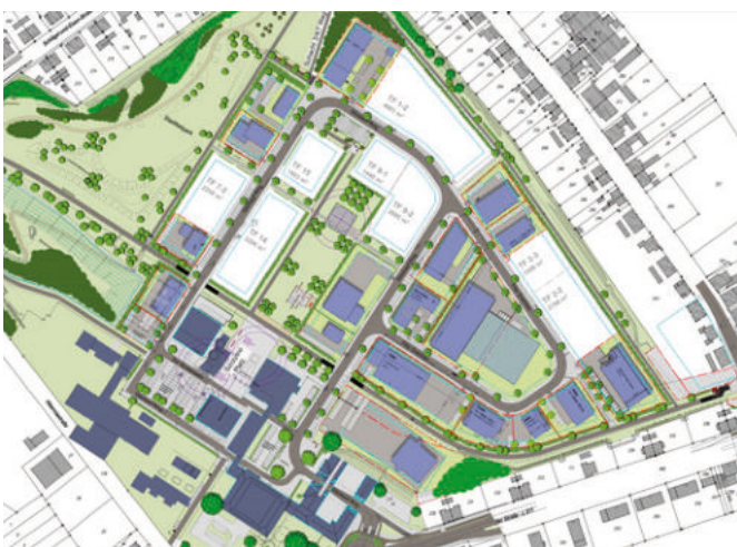
Vermarktungsplan Gewerbegebiet Schlägel & Eisen September 2018

Auch die Flächen des ehemaligen Bergwerks Lippe auf der Stadtgrenzen Gelsenkirchen-Herten sollen zukünftig wieder gewerblich genutzt werden. Die Fläche wird im Rahmen der Projektpartnerschaft mit der Stadt Gelsenkirchen und der RAG Montan Immobilien GmbH entwickelt. Die „Neue Zeche Westerholt“ bietet zukünftig auf 33 Hektar attraktive Flächen für die Entwicklung von Gewerbe- und Wohnprojekten mit einer identitätsstiftenden Kulisse von historischen Gebäuden, einer sehr guten lokalen Verknüpfung mit den umgebenden Stadtteilen, einer hervorragenden Vernetzung in der Metropole Ruhr, der zentralen Lage an der Allee des Wandels und einer hohen Freiraumqualität.