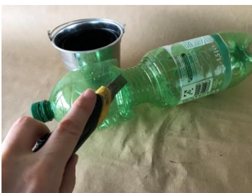
Abbildung 3: Schritt 1, Mini Gewächshaus

PET- Einwegflasche, Erde, Blumenunter- und Obertopf, Cuttermesser, Blumensamen, Löffel oder kleine Schaufel