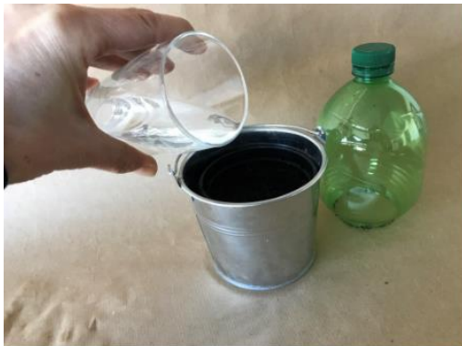
Abbildung 5: Schritt 3, Mini Gewächshaus