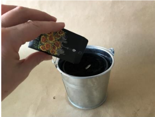
Abbildung 4: Schritt 2, Mini Gewächshaus (Ruckriegel/ZBH)