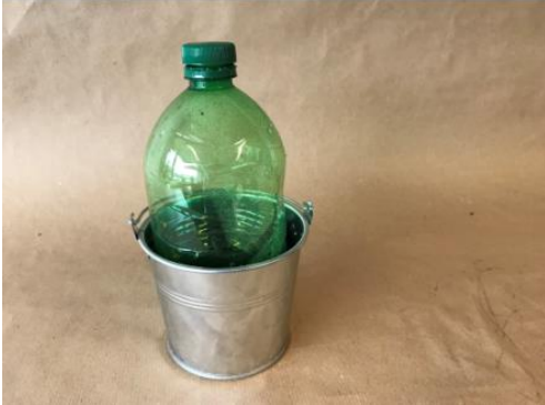
Abbildung 1: Mini Gewächshaus (Ruckriegel/ZBH)