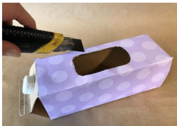
Abbildung 3: Schritt 2, Gitarre aus Milchkarton

Leerer Milchkarton, buntes Papier zum Bekleben, Klebe, Schere, Gummibänder in unterschiedlicher Länge, Cuttermesser, Musterklammern, Stift und Lineal