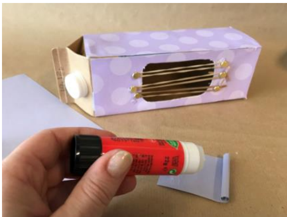
Abbildung 6: Schritt 5, Gitarre aus Milchkarton

Den Klang der Bänder überprüfen und evtl. kürzen.