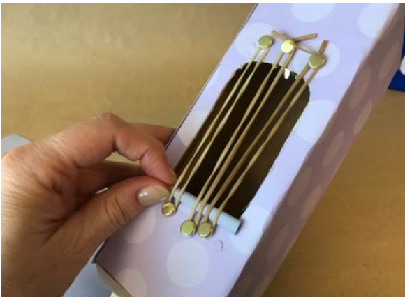
Abbildung 7: Schritt 6, Gitarre aus Milchkarton