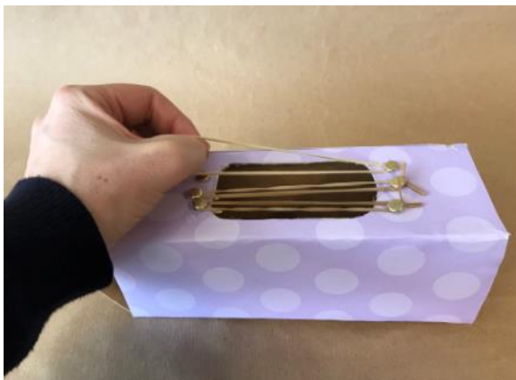
Abbildung 5: Schritt 4, Gitarre aus Milchkarton

Jeweils ein gegenüberliegendes Loch (hier werden dann die Gummibänder gespannt).