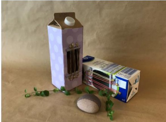
Abbildung 1: Gitarre aus Milchkarton (Ruckriegel/ZBH)