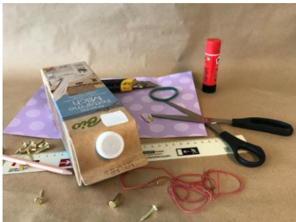
Abbildung 2: Gitarre aus Milchkarton (Ruckriegel/ZBH)