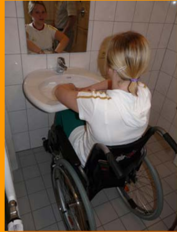
Platz unterm Waschbecken, Tiefer gelegter Wandspiegel