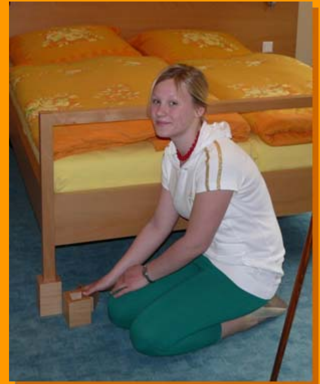
Höhenverstellbar mit einfachen Mitteln