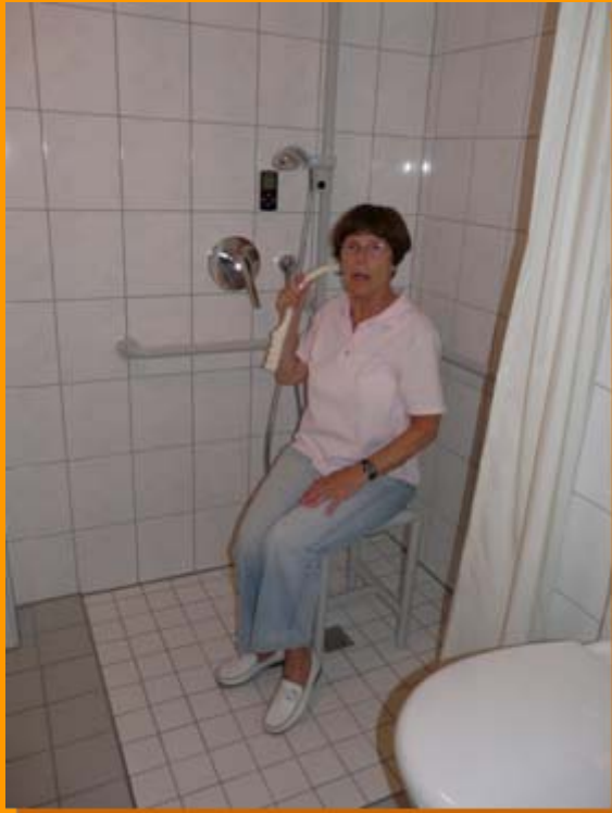
Dusche ohne Stolper- Kanten und Sturzgefahr