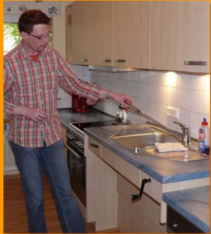
Höhenverstellbare Arbeitsplatte Flexible Handbrause