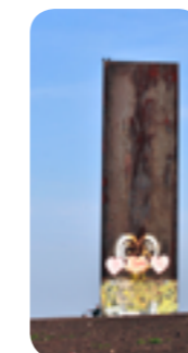
Halde Schurenbach mit der „Bramme für das Ruhrgebiet“

www.ruhr2010.de, www.emscherlandschaftspark.de, www.kulturkanal.net, www.emscherkunst.de, www.gasometer.de, www.nordsternpark.info, www.zollverein.de, www.landschaftspark.de