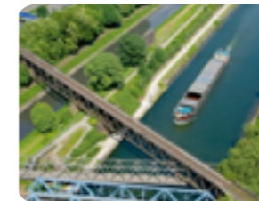
Rhein-Herne-Kanal, Oberhausen