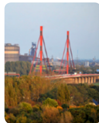
Alleestraßenbrücke über dem Rhein-Herne-Kanal, Foto: RUHR.2010/Thomas Robbin

Rund 80.000 Fahrzeuge rollen täglich zwischen Kamp-Lintfort und Dortmund über den Asphalt. Die Attraktionen, die sich links und rechts quer durch den Emscher Landschaftspark ziehen, fanden dabei lange Zeit kaum Beachtung. So genanntes „Straßenbegleitgrün“ säumte die Autobahn einheitlich über weite Strecken und verhinderte den Blick in die angrenzenden Räume. Dass dieses Grün aus Sicherheitsgründen saniert werden musste, machte den Weg frei für die Umsetzung der Idee, die die Planungsbüros foundation 5+, Kassel und die Planergruppe Oberhausen bereits 2004 im Rahmen des Masterplans Emscher Landschaftspark 2010 entwickelten: Aus dem Emscherschnellweg sollte die erste Parkautobahn der Welt werden.