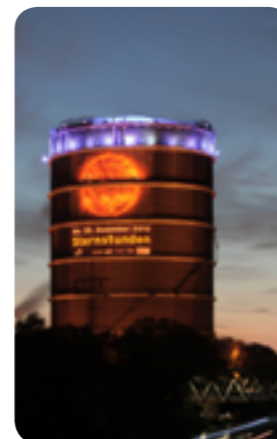
Gasometer Oberhausen, Foto: Sven Siebenmorgen