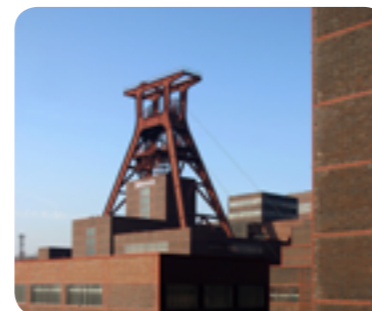
UNESCO Welterbe Zollverein, Essen