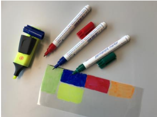
Abbildung 7: Schritt 5 (Ruckriegel/Zentraler Betriebshof Herten)