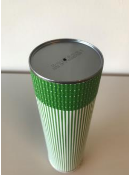
Abbildung 10: Schritt 8 (Ruckriegel/Zentraler Betriebshof Herten)