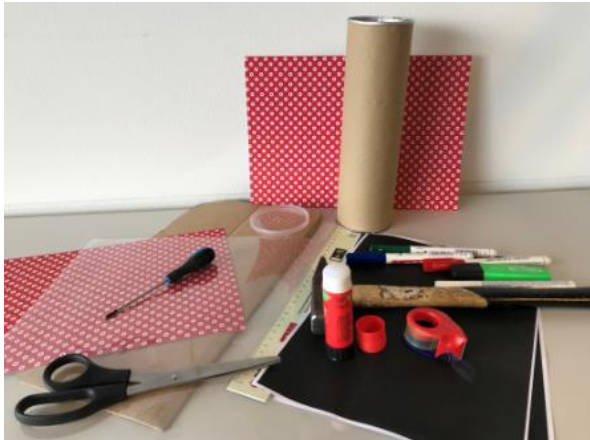
Abbildung 1: Material

Leere Chipsdose mit Deckel (Größe hier 25,5 cm x 7,5 Durchmesser), Pappe, schwarzes Papier, klare Kunststoffolie (z.B. Laminierfolie), Klebe, Schere, Klebefilm, Hammer, Lineal, Schraubenzieher oder Ähnliches zum Loch bohren, bunte Permanentmarker, Papier zum Bekleben