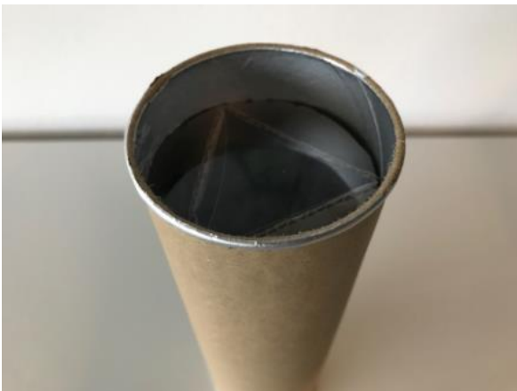
Abbildung 6: Schritt 4b (Ruckriegel/Zentraler Betriebshof Herten)