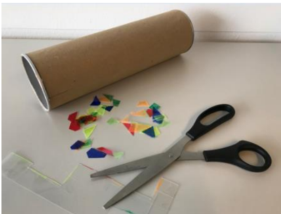
Abbildung 8: Schritt 6 (Ruckriegel/Zentraler Betriebshof Herten)