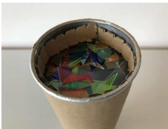
Abbildung 9: Schritt 7 (Ruckriegel/Zentraler Betriebshof Herten)

Die bunten Felder in verschiedene Formen schneiden.