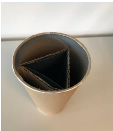
Abbildung 3: Schritt 2 (Ruckriegel/Zentraler Betriebshof Herten)

Streifen in die Dose schieben, so dass sie dort ein Dreieck bilden. Die dunklen Flächen zeigen nach innen.