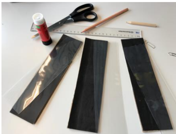
Abbildung 2: Schritt 1 (Ruckriegel/Zentraler Betriebshof Herten)