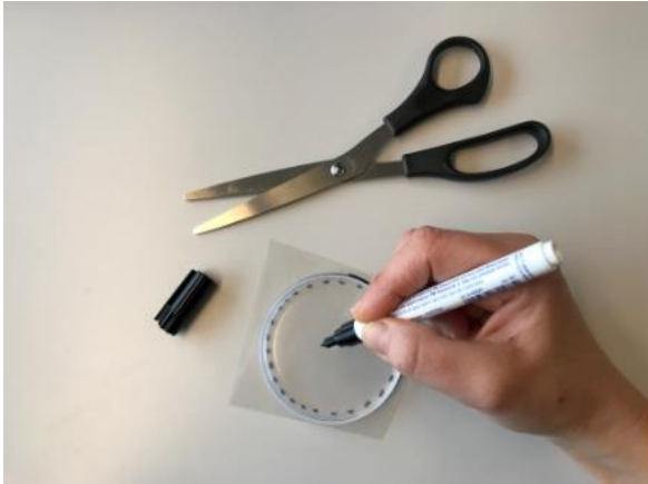
Abbildung 4: Schritt 3 (Ruckriegel/Zentraler Betriebshof Herten)